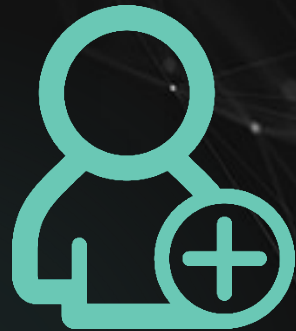
Project Management (DPO)

Τα άτομα που πρέπει να συνεργαστούν σε ένα έργο συμμόρφωσης